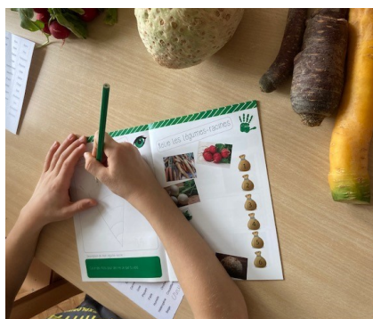
Retour atelier « légumes-racines » 2020-2021

Ah, c'est bizarre, j'veais pas aimer ! Au fait, ça va, c'est bon quand même !