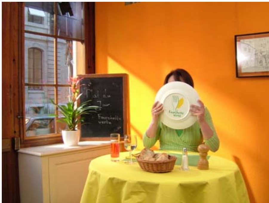
Photos prises pendant la réalisation du spot TV pour Fourchette verte suisse (Diffusion de 109 spots sur la TSR et la TSI entre le 19 avril et le 7 mai 2004; diffusion supplémentaire gratuite de 10 spots du 11 au 14 mai 2004)